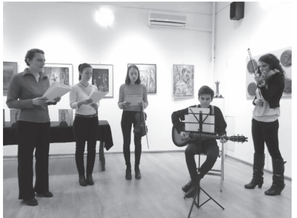
A maroszentgyörgyi Szent Cecília együttes a Vadárvácska alkotótábor 2018. január 11-én nyílt kiállításán a Bernády Házban

Nem tudom, mikor vettem észre a lába előtt heverő túleveleket. A büszke ágak hirtelen megereszkedtek, úgy meredtek a szőnyegre, mint díszeket tehernek érző, valamennyitől megválni vágyó, elfáradt testrészek. Nagymamám rejtélyes, legyőzhetetlen fáradtsága jut mindig eszembe a szolgálatukat letöltött karácsonyfákról. A két virágos pongyolában elvesztődött, kicsi gondviselő, akiről ugyanúgy lekíváncoztak a földi díszek közös létünk utolsó napjaiban. Az ő távozás előtti nyugalomát éreztem fenyőfánkon is. És akkor, teljesen váratlanul meg-