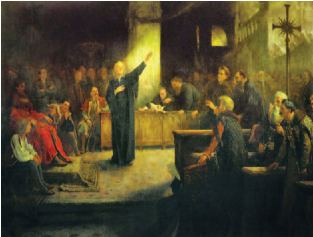
Körösfői Kriesch Aladár festménye

Ezután a festő Tordán és Kolozsváron modellek, történelmi díszletek után nézett. Kolozsváron korabeli öltözeteket varratott, és még a városi szegényházba is ellátogatott, ahol talált is egy „jó arcú” öreget. Dávid Ferencről nem maradt fenn semmilyen hiteles