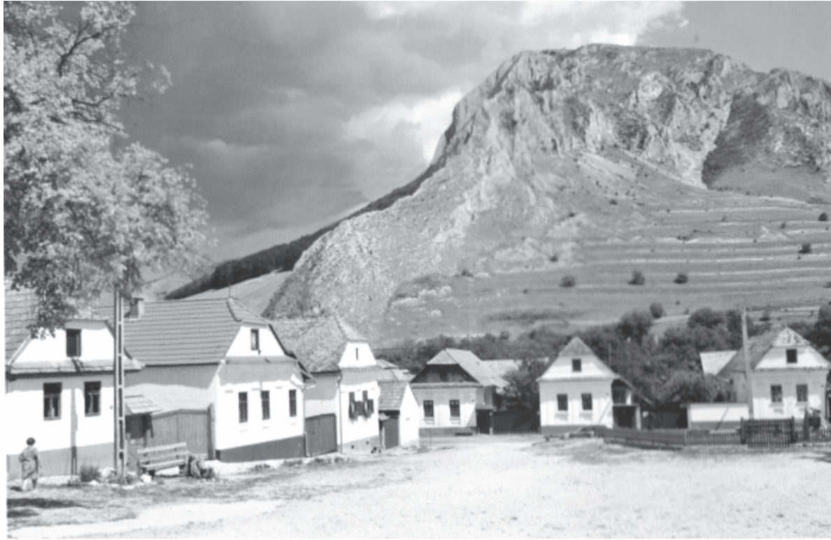
Torockó épített öröksége