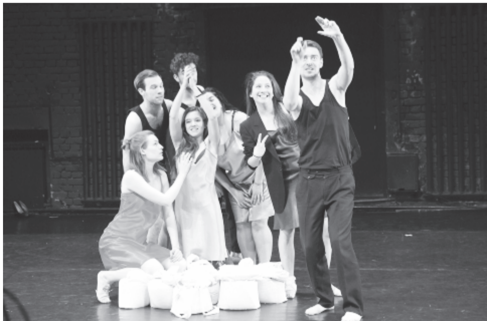
Jelenet az előadásból

A bemutatót követően január 16-án látható újra az előadás. A Stúdió Színház műsoráról bővebb információt a www.studioszinhaz.ro honlapon találunk.