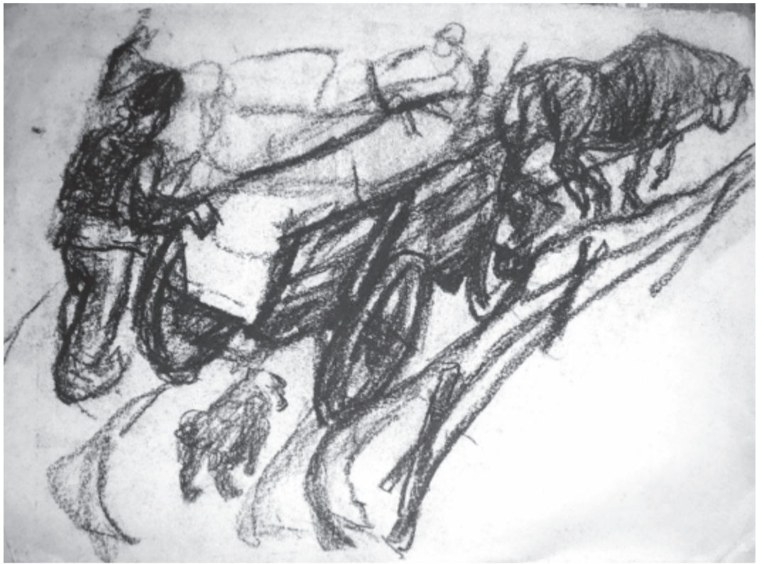
Hazafelé... Sükösd Ferenc rajza

Akkor éjjel Erdély-hosszat bokáztak az akasztottak.